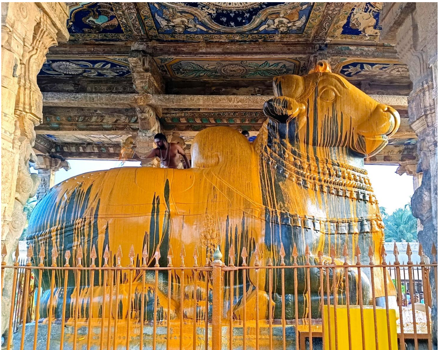
Bain rituel du taureau Nandi, animal associé à Shiva, au temple de Thanjavur (Sud de l'Inde)